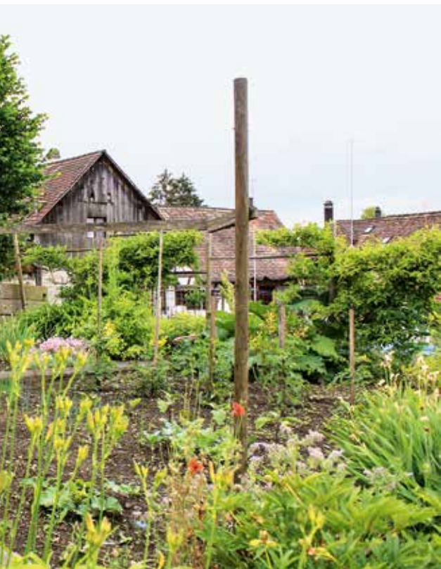
SMS Landschaftsarchitektur (2)